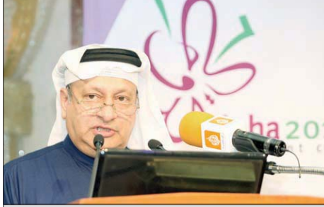
إمادة على شرف اتحادات الرياضة بقطر